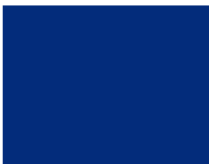
· RAL5005 Niebieski