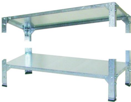
· dodatkowe płytki usztywniające narożniki