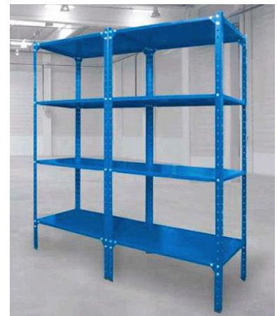
· regały mogą być łączone w ciągi